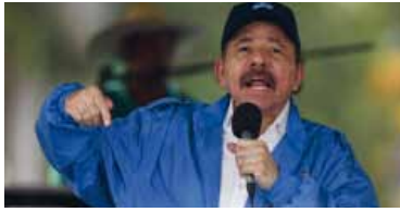
El presidente Daniel Ortega.

La CIDH insta a Nicaragua que cese con violaciones a los Derechos Humanos