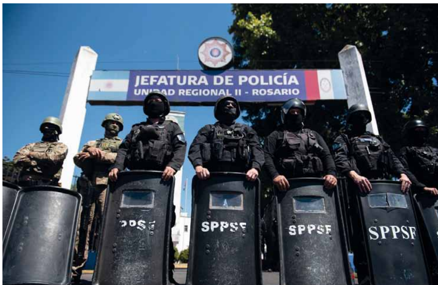
Los efectivos se acuartelaron y además hubo sirenazos en Rosario y en distintos puntos de la provincia.

bierno y las consultoras privadas. El dato también se ubicó por encima del 2,4% proyectado por el Relevamiento de Expectativas de Mercado del Banco Central. Los precios estacionales treparon 5,7% y los regulados subieron 2,4%. Página 2