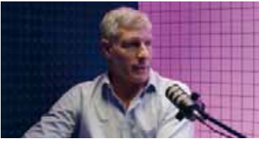
Recordó cuándo comenzó.

Palermo se refirió al quiebre con Riquelme