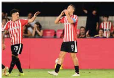
Presentes. Habrá hinchas contra Banfield.

El pasado 11 de noviembre, Racing también contó con la presencia de su parcialidad en su última visita al estadio Florencio Sola