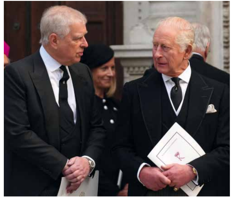
Despegue. El monarca decidió proteger al resto de la familia real del escándalo.

El compromiso del palacio de cooperar con la policía es la más