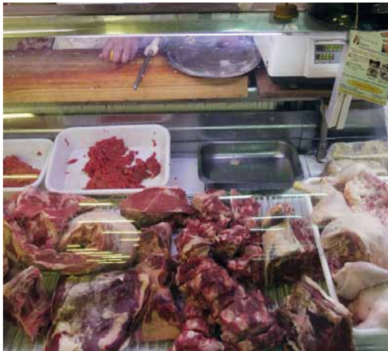
Para arriba. Las carnes fueron clave para el nuevo incremento del IPC.

En contraste, a nivel general las menores variaciones se observaron en "Educación" (0,6%) y en "Prendas de vestir y calzado", que incluso mostraron una baja