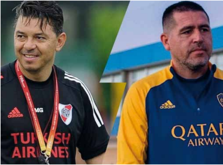
Soberbia. Los ídolos parecen olvidarse de que el escudo está por encima de los nombres.

En estas cuatro fechas, River es el equipo que más disparos ejecuta por partido: casi 18. También, uno