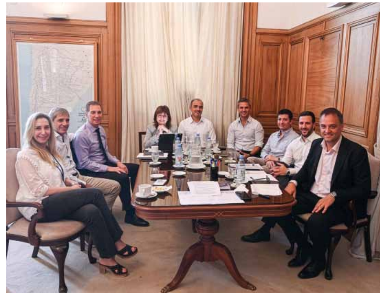
Definiciones. La mesa política aceptó el punto de vista del ala dialoguista.

Entre los puntos ajustados estarían, entre otros, los artícu-