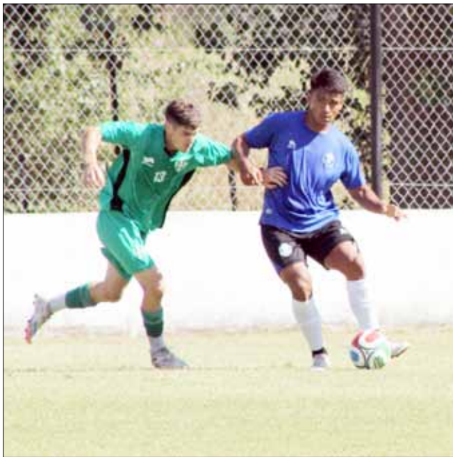
El Celeste hizo dos amistosos antes del debut: frente a Sarmiento, en Junín y ante Gimnasia de Chivilcoy, en Alem.

Ciudad de Bolívar tacha los días. Ya falta cada vez menos para su debut absoluto en la Primera Nacional. Este viernes, el equipo celeste se medirá ante Godoy Cruz, en Mendoza, en un hecho inédito para el fútbol local. Con miras a este primer partido oficial, el plantel se entrenará hoy desde las 8.30 horas en el predio del complejo José Dome-