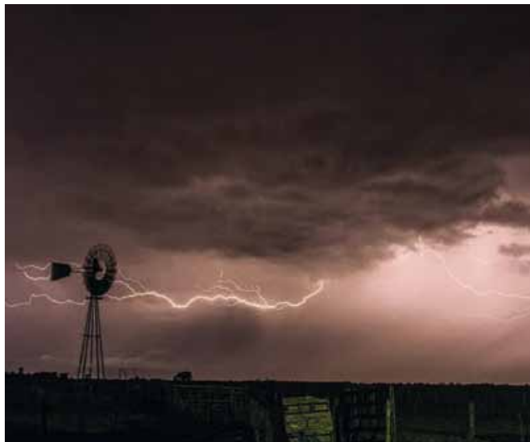
Clima. Se esperan fuertes vientos y tormentas

Los vientos con ráfagas, en tanto alerta amarilla, podrían rondar los 35-70 km/h, con ráfagas \geq 90 km/h; las tormentas llagarían con lluvias intensas, posible caída de granizo y acumulados de agua de entre 10 y 30 mm.