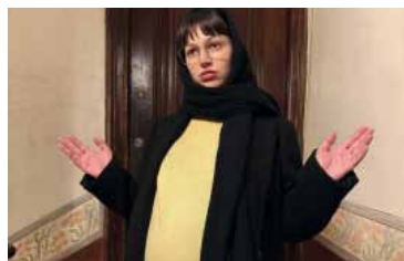
Radiante. La foto que publicó Darín días atrás.

do la noticia de su embarazo el 9 de septiembre de 2025 con una postal íntima en redes sociales y una frase que rápidamente se volvió viral: "Esto no es IA". - DIB -