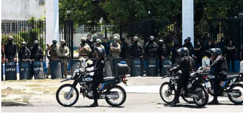
Manifestación. Frente a la Jefatura de la Unidad Regional II de Rosario, donde hubo quema de cubiertas.

Tras las protestas, que también incluyó a personal del Servicio Penitenciario, el gobierno provincial anunció que 20 agentes fueron pasados a disponibilidad.