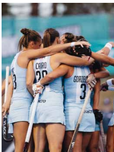
Unión. La Selección brilló.

Por su parte, "Los Leones" iniciaron la segunda ventana en India con un partido lleno de